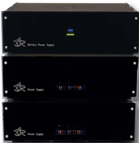
Trois boîtes indispensables (deux alimentations et une batterie) et des câbles de grue de chantier pour passer le colossal courant.